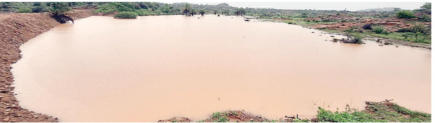
જળસંગ્રહનાં કામો થકી આવા આંખ ઠારતા દૃશ્ય કચ્છમાં ઠેર ઠેર જોવા મળે છે.