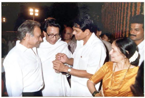
શિવસેના પ્રમુખ બાલાસાહેબ ઠાકરે અને સંગીતકાર આણંદજીભાઈ સાથે હળવી પળોમાં.