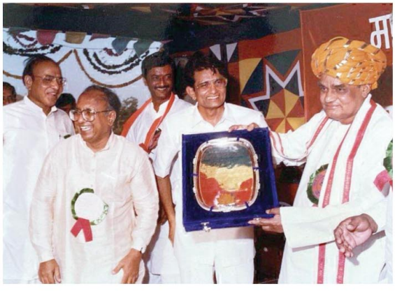
પૂર્વ વડાપ્રધાન અટલબિહારી વાજપેયી અને પૂર્વ મુખ્યમંત્રી સુરેશભાઈ મહેતા સાથે

“ અમારા બાહુમાં બળ હશે ત્યાં સુધી રણને અમે દૂર-દૂર ફેંકી દઈશું. માત્ર ગુજરાતને નહીં સમગ્ર રાષ્ટ્રને આબાદ બનાવીશું અને આગળ ધપાવીશું. ”